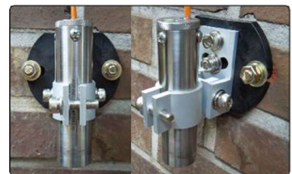
[진동현식 경사계 설치]