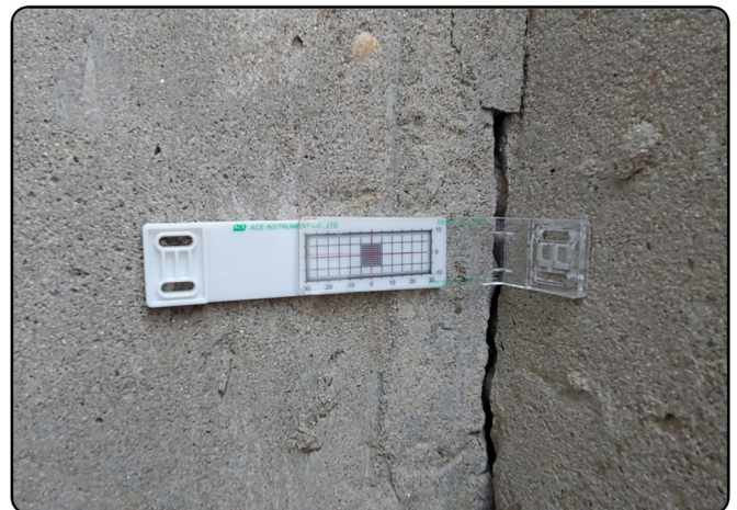
[SC-100C 모서리부 직각 설치]