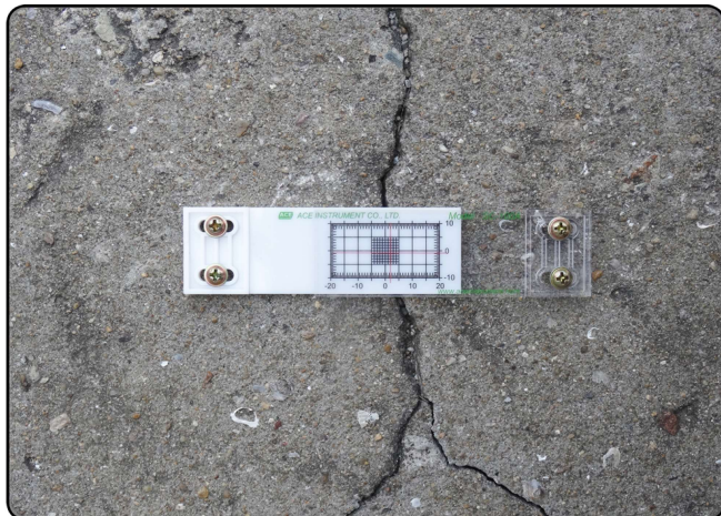
[SC-100A 바닥면 수평 설치]