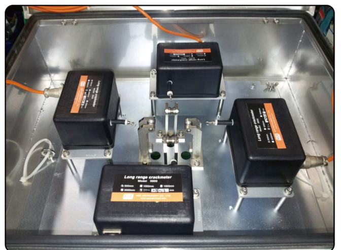
[다축 센서 Head부]