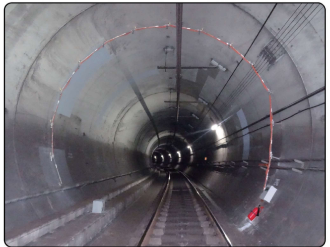
[서울 지하철에 설치된 ACE-TCS]