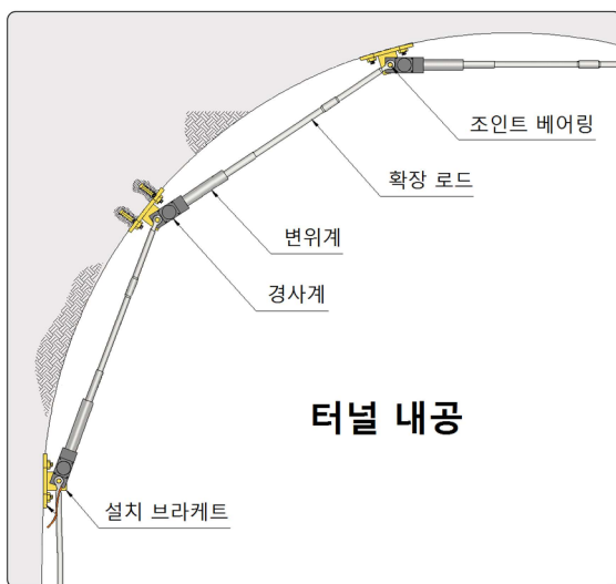
[터널 내공변위 시스템 설치도]