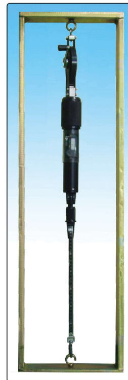
[모델 2350DF 교정 후레임]