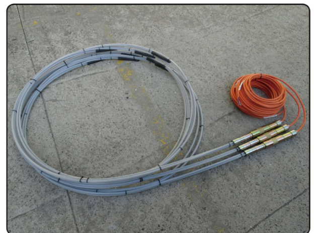
[모델 : 1391 조립 제품 사진]